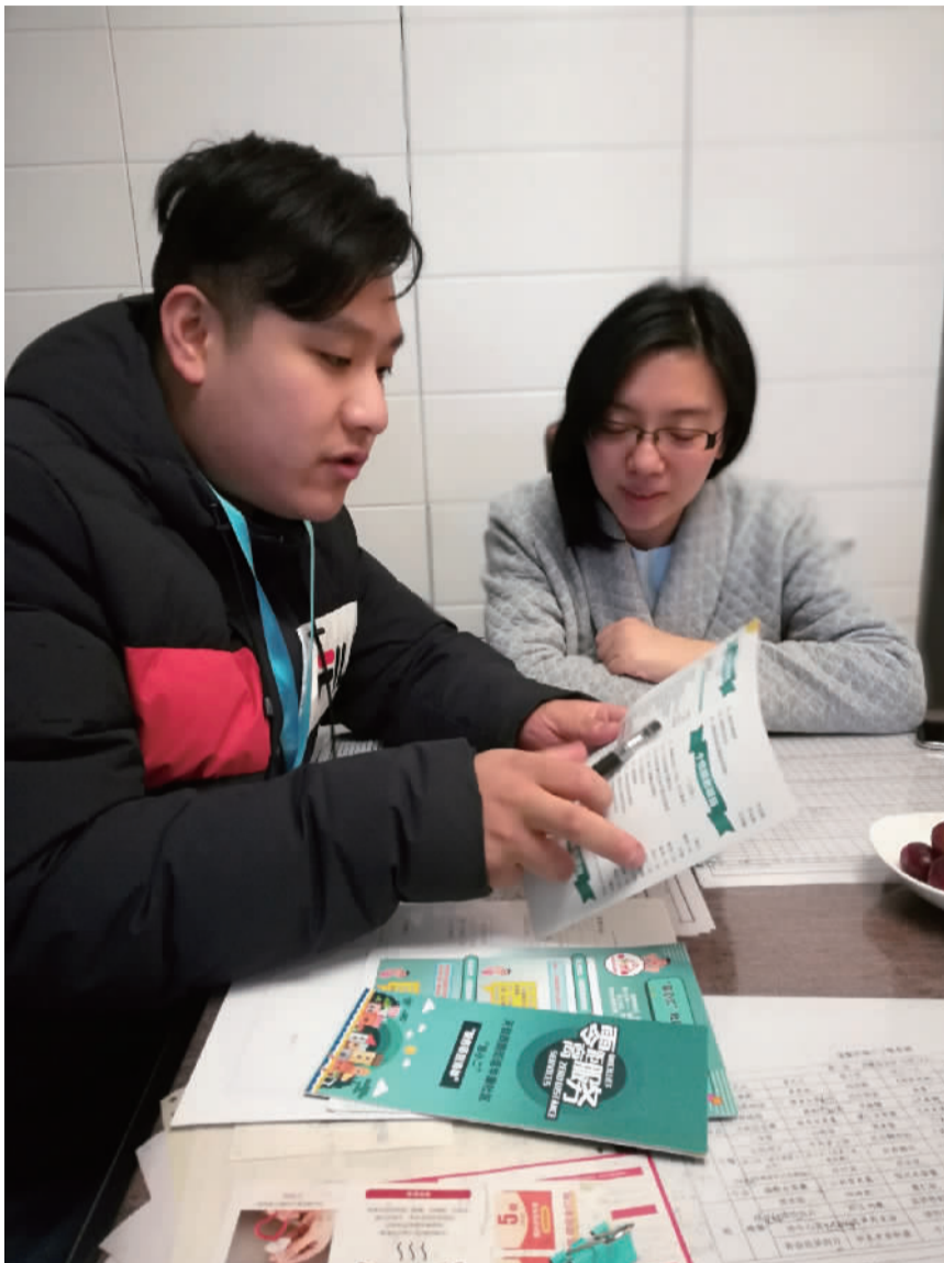
居民区书记(左)在居民家中走访

天要上班,晚上回家时间不定,居委干部上门走访常常“扑空”;有些居民“怕麻烦”,听到居委会干部走访,门都不肯开,或者打开门,明确表示不希望接受走访。