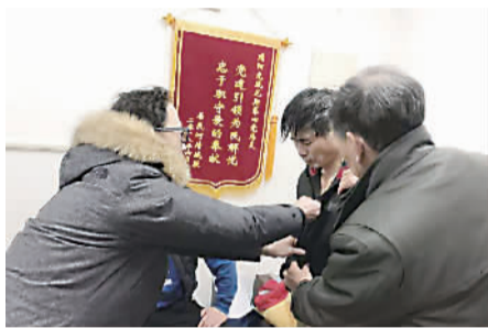
好心志愿者拿来御寒衣物和姜茶

1月14日晚上7点，一位50多岁的男子走在靖边路桥上（小区围墙外）不慎落水至阳光四委小区河道里。