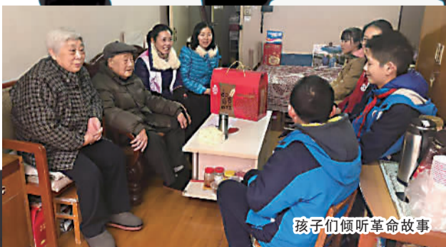
孩子们倾听革命故事