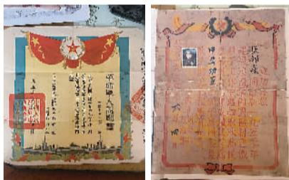
革命军人证明书 立功喜报