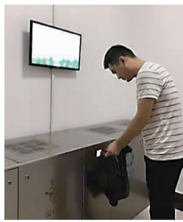
上班族扫码扔垃圾