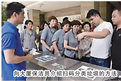
向大厦保洁员介绍扫码分类垃圾的方法

在普陀桃浦，因为拥有快乐柠檬、一点点等企业而被称为“奶茶大厦”的李子园大厦，就装上了入驻企业自主研发的智能垃圾分类系统，扫描专用垃圾袋上的二维码，才能开启智能垃圾箱进行垃圾分类投放。若投放错误，保洁阿姨可是能通过后台追溯，进行上门教育。