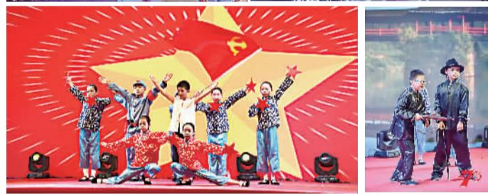
大合唱《不忘初心》 桃浦中心小学