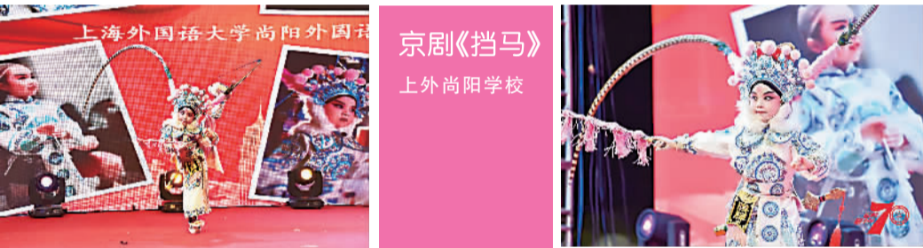
京剧《挡马》 上外尚阳学校