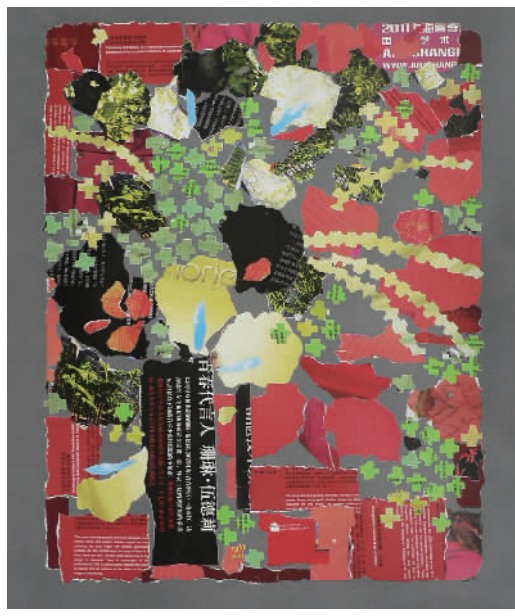
《撕纸画》石华(善水楼)