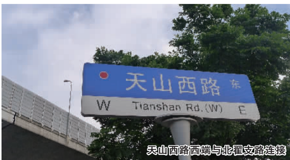
天山西路西端与北翟支路连接