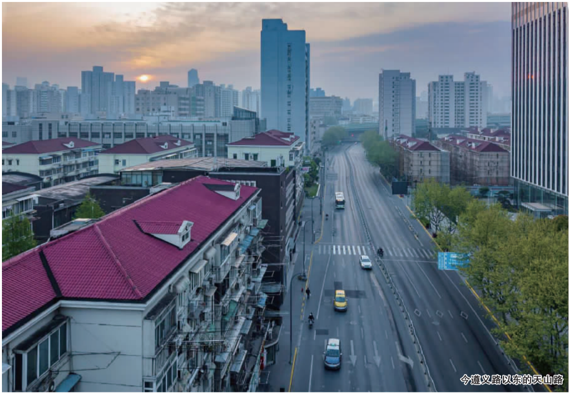
今遵义路以东的天山路