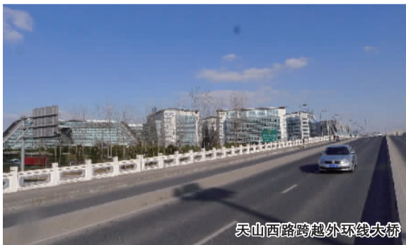
天山西路跨越外环线大桥