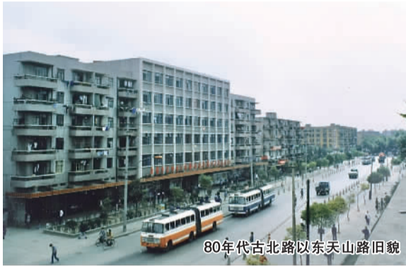
80年代古北路以东天山路旧貌