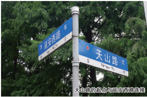
天山路起点与延安西路连接