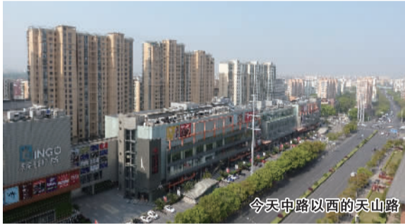
今天中路以西的天山路