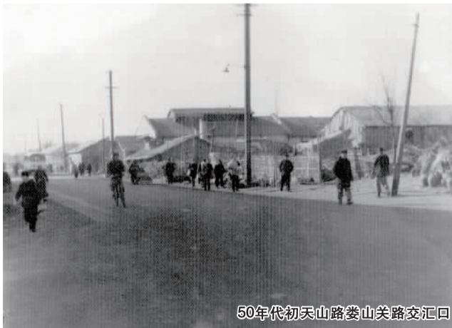
50年代初天山路娄山关路交汇口