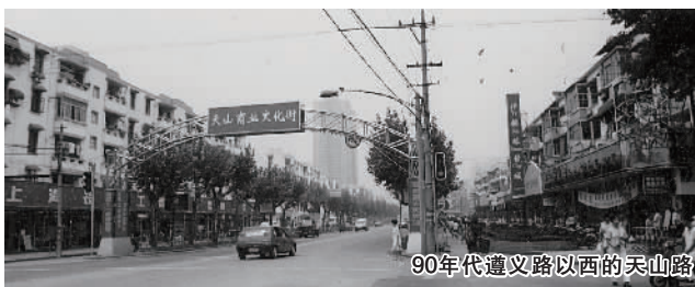
90年代遵义路以西的天山路