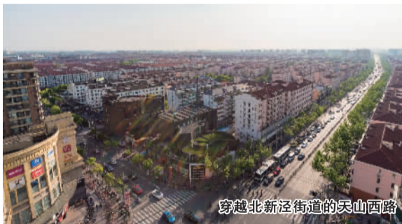
穿越北新泾街道的天山西路