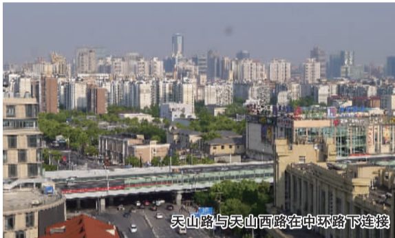
天山路与天山西路在中环路下连接