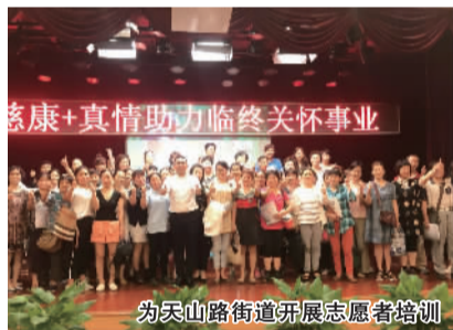
为天山路街道开展志愿者培训

采访自然从这份协议执行谈起。据肖总介绍,委培项目由他人担任指导小组组长,先后组织讲座、走访、座谈、联欢等形式活动25场。10个街道镇总共培训志愿者926人次,其中自愿登记志愿者信息表的有488人,经考核合格后颁发结业证书488人,其他438人因各种原因暂未申报志愿者。开展“一对一”助老上门安宁疗护服务193人次;慰问演出服务老人233人次;受益1352人次。因尚未接到区民政局指派的善终服务任务,“5年内免费为民政局审核指定的独居、困难老人提供善终服务(不超过20人)”这一条执行尚处空白。