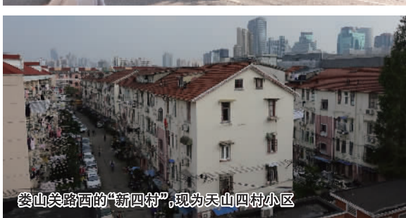
娄山关路西的“新四村”，现为天山四村小区