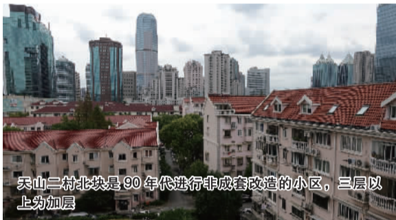
天山二村北块是90年代进行非成套改造的小区，三层以上为加层