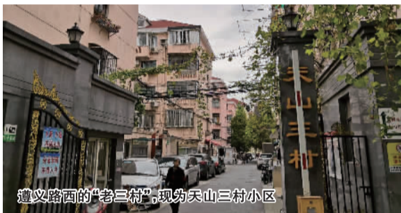
遵义路面的“老三村”，现为天山三村小区