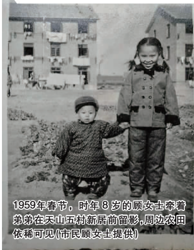
1959年春节，时年8岁的顾女士牵着弟弟在天山五村新居前留影，周边农田依稀可见