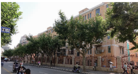
经非成套改造后的“老四村”沿娄山关路一侧新貌