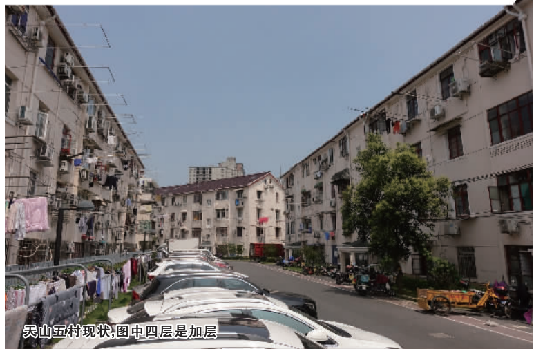
天山五村现状，图中四层是加层