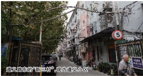
遵义路东的“新三村”，现为遵义小区