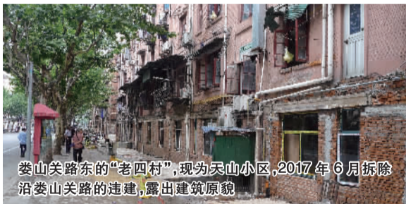
娄山关路东的“老四村”，现为天山小区，2017年6月拆除沿娄山关路的违建，露出建筑原貌