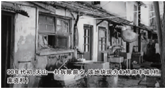
90年代初，天山一村拆除前夕，该地块现为虹桥南丰城（档案资料）