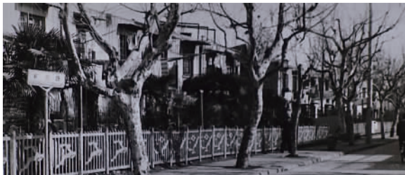
天山一村为两层排屋，图为1986年紫云路遵义路转角处