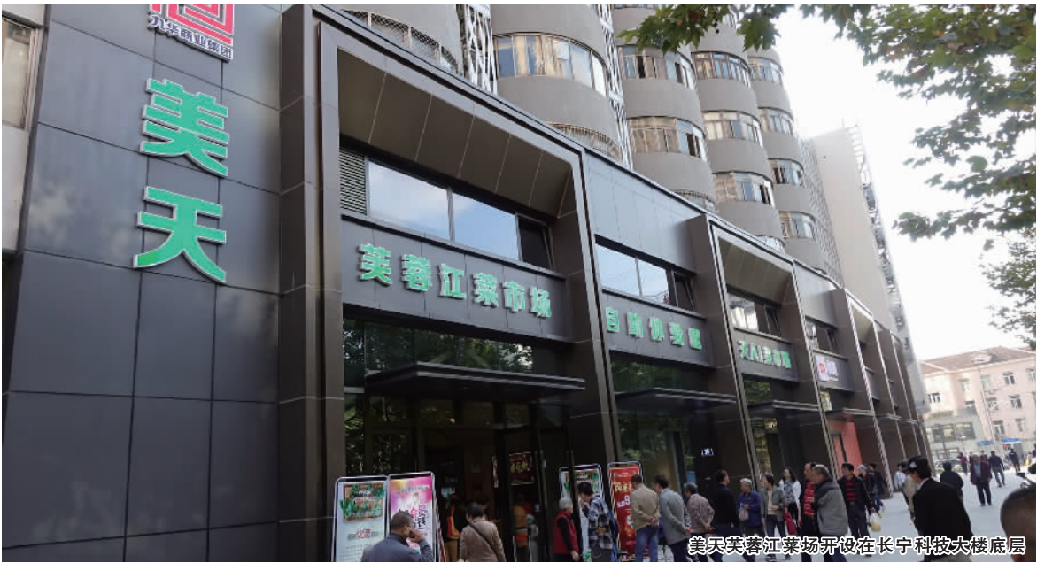
美天芙蓉江菜市场开设在长宁科技大楼底层