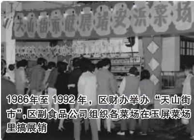
1986年至1992年,区财办举办“天山街市”,区副食品公司组织各菜场在玉屏菜场里搞展销