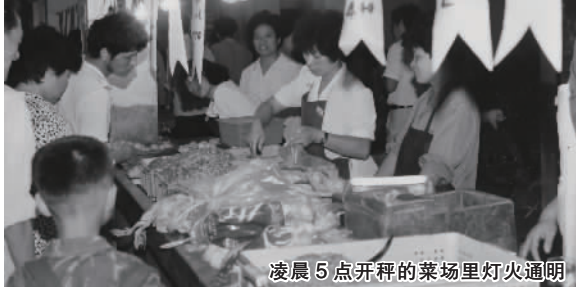
凌晨5点开秤的菜场里灯火通明