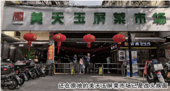
还在原地的美天玉屏菜市场已是改头换面

如果把当年的天山、玉屏菜场视为菜场1.0版本的话,那么现在的芙蓉江菜市场是2.0版。上海市2.0版本的超市型标准化菜市场的相关标准是由市商务委制定。长宁首家建成的是美天平塘菜市场,稍后建成的是美天安顺菜市场,再后建成便是美天芙蓉江菜市场。