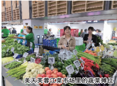
美天芙蓉江菜市场里的蔬菜摊位