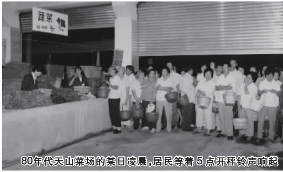
80年代天山菜场的某日凌晨,居民等着5点开秤铃声响起