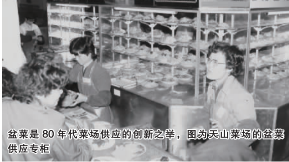
盆栽是80年代菜场供应的创新之举,图为天山菜场的盆栽供应专柜