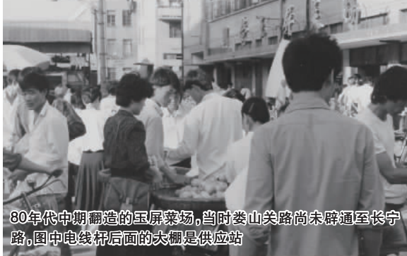
80年代中期翻造的玉屏菜场,当时娄山关路尚未辟通至长宁路,图中电线杆后面的大棚是供应站