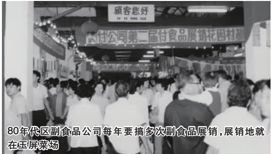
80年代区副食品公司每年要搞多次副食品展销,展销地就在玉屏菜场