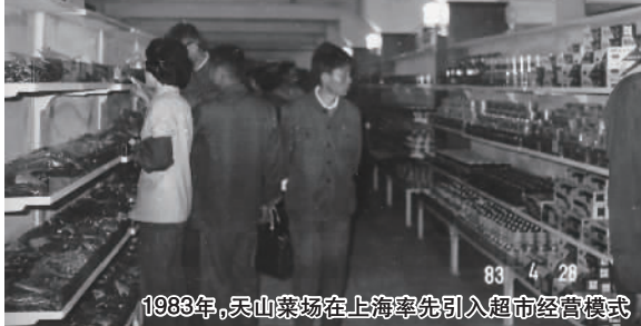
1983年,天山菜场在上海率先引入超市经营模式