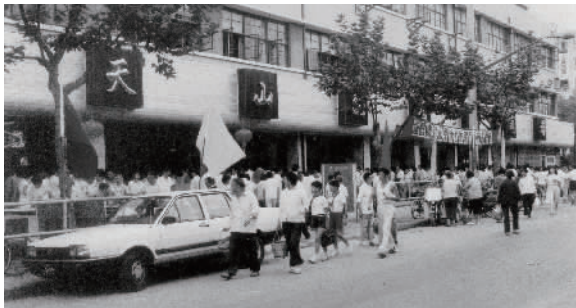
天山菜场大门面朝遵义路,该地块现在是 SOHO 天山广场