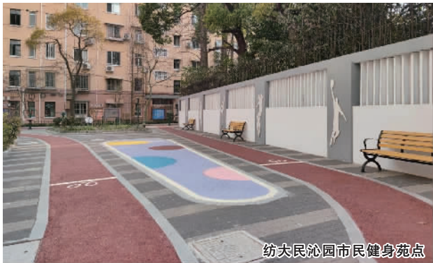
纺大民沁园市民健身苑点