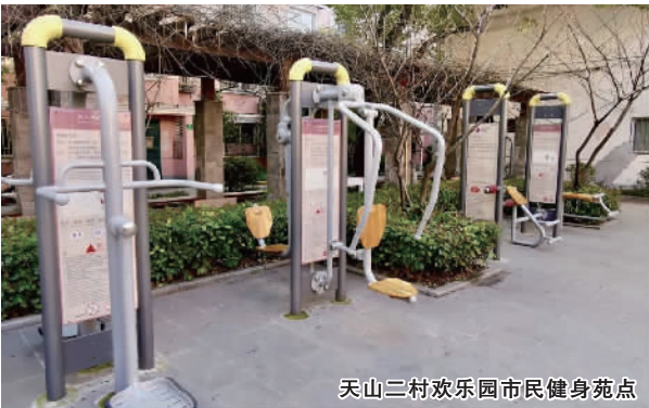
天山二村欢乐园市民健身苑点

为推进公共体育服务均衡发展,不断满足群众日益增长的多样化体育健身需求,天山路街道在体育健身苑点建设方面强化合理布局,结合社区实际,打造各具特色的市民健身苑点,打通全民健身“最后一公里”。 ● 纺大民沁园市民健身苑点 纺大民沁园市民健身苑点位于纺大小区 240 弄 25 号北面,为社区居民提供健身娱乐、普法宣传、公共议事等功能。居民们不仅能够在这里开展日常体育健身活动,还可学习常用的普法小知识。幽静的法制长廊上有着从古到今法制名人的介绍,