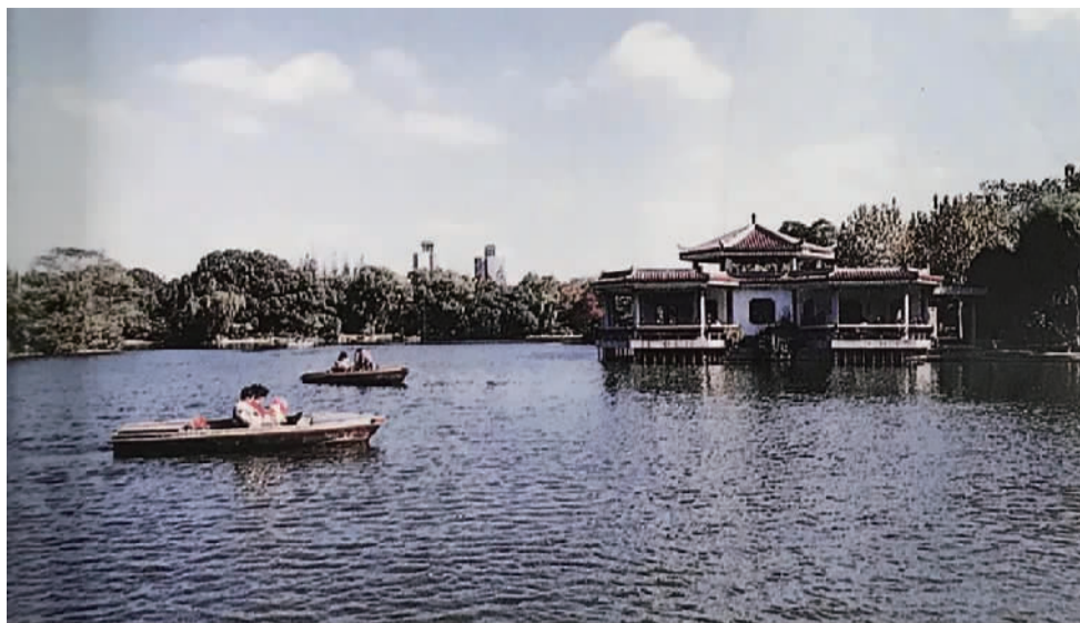
20世纪90年代杨浦公园水榭与游船