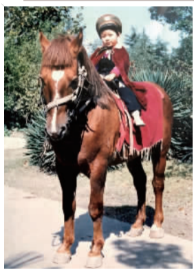
作者幼时在杨浦公园骑马时的留影

杨浦公园的几次改建,把公园建设得越来越美丽、越来越适宜游玩。我想,这个公园一定会一直安静地度过她的80周年、100周年,甚至200周年生日。因为我们一代代人对她有着不一样的感情,而这样的感情也会一代又一代地传承下去。