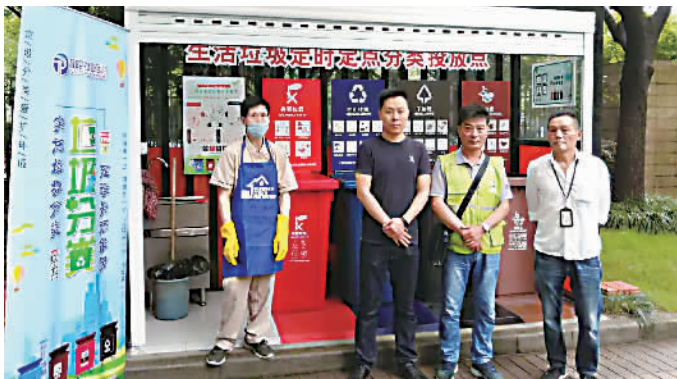
万里街道生活垃圾分类定时定点投放点