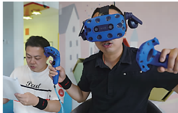
团体项目“拆炸弹”考验选手配合及反应能力

整场比赛中,官兵和居民们斗志高昂,纷纷拿出各自的看家本领,比速度、比技巧,期间掌声、欢呼声不断。