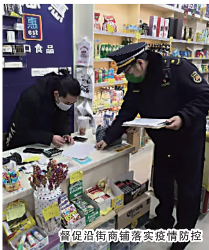
督促沿街商铺落实疫情防控