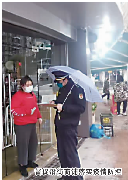
督促沿街商铺落实疫情防控