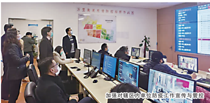
加强对辖区内单位防疫工作宣传与管控

街道还组建由分管领导牵头，街道业务科室、城管、市容服务队组成的沿街店铺专项工作组，负责484家沿街店铺的防疫宣传、复工备案审核、每日巡查工作。市场监管所对药店、集贸市场、小菜店、小餐饮开展全面排摸和每日巡查。如发现违反规定或私自复工的商家，联合公安、市场监管、城管部门共同按照有