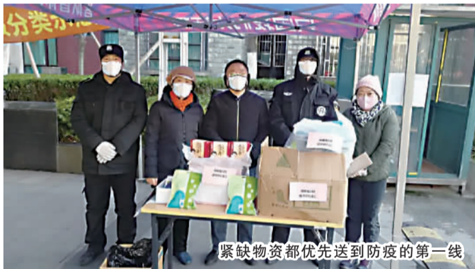
紧缺物资都优先送到防疫的第一线

同志们加班加点普查资料库、实有人口数据库,通过入户排查、电话回访,逐一了解其本人及家庭的动态。同时依靠群众、楼组长、党员等志愿者提供的