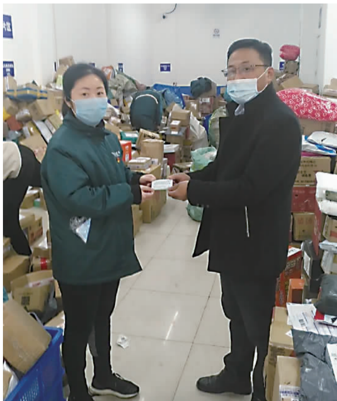
发放“特定行业人员出入证”

万里街道新冠肺炎疫情防控领导小组深入居民区调研走访防控工作，对严防严控期间，一些民生保障工作遇到的