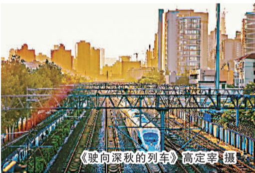
《驶向深秋的列车》

秋天，是大自然中色彩最为绚丽的季节。秋天是迷人的，天高云淡，枫叶似火；秋天是喜悦的，遍地金华，硕果累累。对摄影人来说，这也是一年中最美的时光，秋日风光，也成为了广大摄影爱好者最喜欢拍摄的主题之一。秋日的浪漫，在斑驳的光影中、在万里城的中央绿地里、在社区的大街小巷旁，更在摄影爱好者们的镜头下。