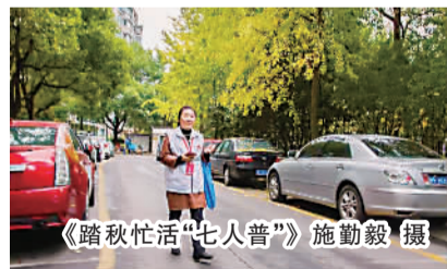
《踏秋忙活“七人普”》