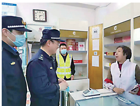
街道开展沿街商铺疫苗接种“扫街”行动

通过社区喇叭、居民微信群通知,张贴海报、横幅,投放电子屏等多种方式同步推进疫苗接种和选民登记宣传,截至4月25日,各居民区已完成选民登记初步工作,助推居民区摸清家底,推动各项重点工作齐头并进。