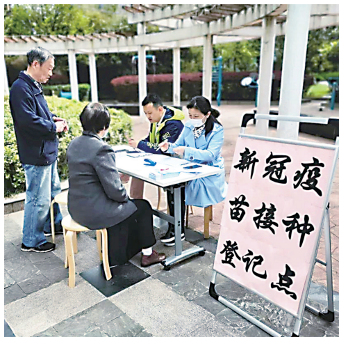
社区工作人员手把手帮助居民完成接种预约