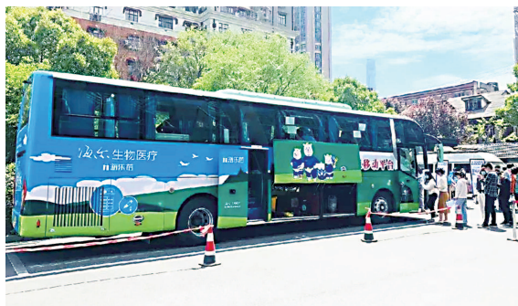
5月8日,万里首辆移动接种车开进园区