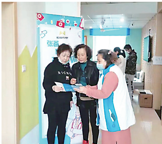
各居民区“挂图作战”,推进疫苗应接尽接