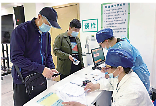
接种点医务人员认真做好预检