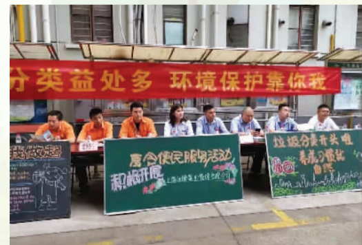
举办垃圾分类宣传活动