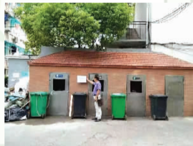
垃圾箱房改造前后对比图