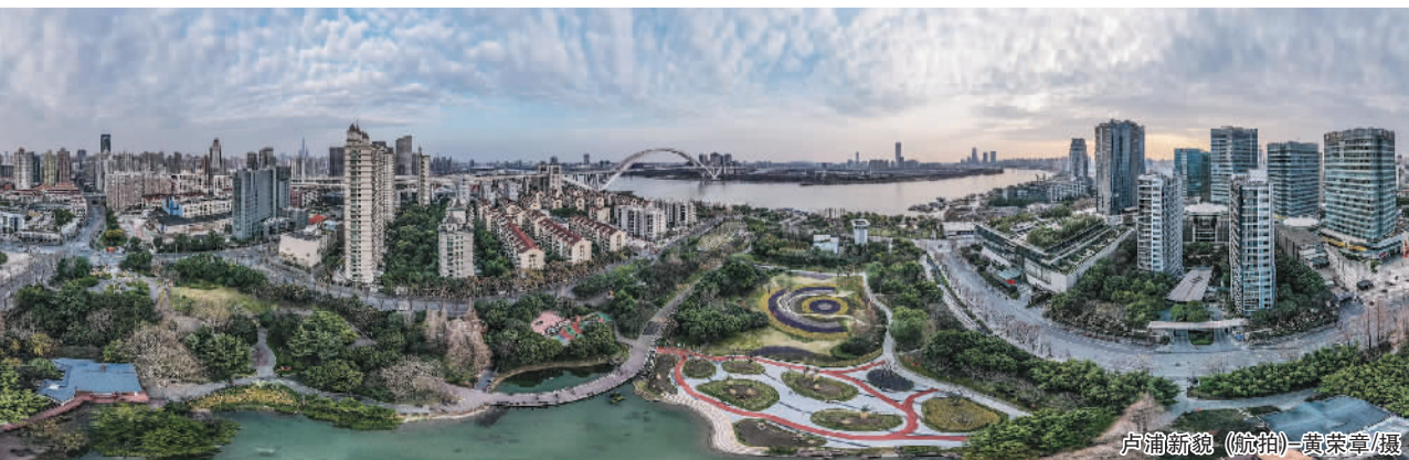
卢浦新貌（航拍）