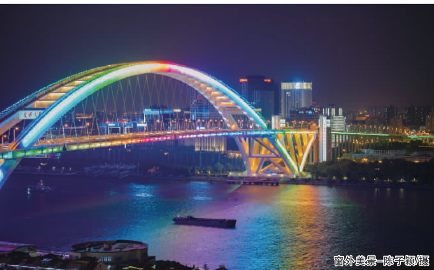
窗外美景