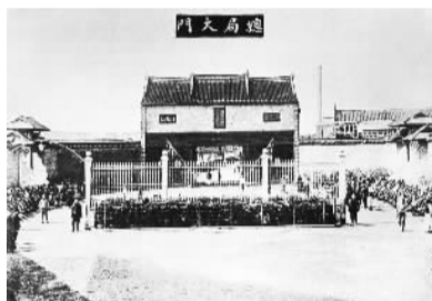
中国“第一厂”——江南机器制造总局