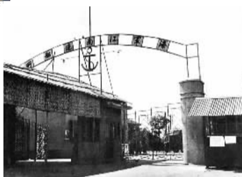
海军江南造船所大门