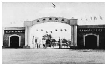
1950年代江南造船厂厂门