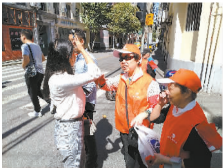
▲中山志愿者们为路人指路、搀扶老人过马路。