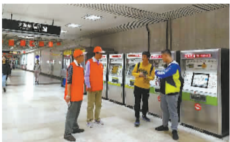
▲志愿者在轨交站点为游客提供问讯导引服务。