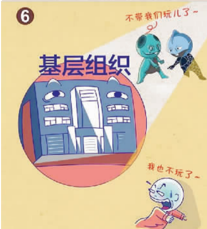
6. 向固本强基、铲除土壤进一步延伸。要把夯实根基作为重要任务,不断增强基层组织对黑恶势力的“免疫力”。