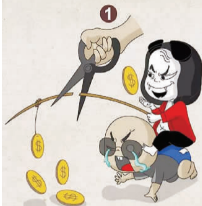
1. 向侦破大案、打财断血进一步延伸。经过一年的强势打击,面上的黑恶势力得到有效清理,剩下的多是“硬骨头”。要以黑恶积案清零、问题线索清零为目标,重头出击、穷追猛打,不断取得突破性成果。

向侦破大案、打财断血进一步延伸 向网络空间、新兴领域进一步延伸 向深挖幕后、打伞破网进一步延伸 向依法惩治、快诉快判进一步延伸 向综合整治、堵塞漏洞进一步延伸 向固本强基、铲除土壤进一步延伸