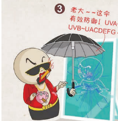
3. 向深挖幕后、打伞破网进一步延伸。黑恶势力能够称霸一方、为非作歹,根本原因在于有“保护伞”、“关系网”。要把打击“保护伞”作为下一步主攻方向,务必做到除恶务尽。