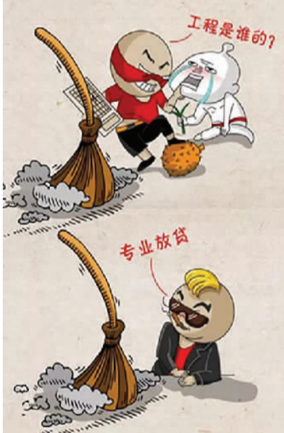
5. 向综合整治、堵塞漏洞进一步延伸。专项斗争能否取得全面胜利,不仅在于打击处理的战果,也在于行业整治的效果。要坚持边打边治边建,从打击为主向打击、整治并重转变,从政法、纪检监察、组织部门为主向各行业主管部门联动转变,努力让各行各业都成为涉黑涉恶问题的“绝缘体”。