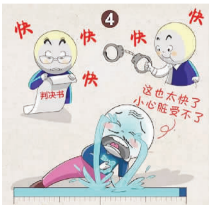
4. 向依法惩治、快诉快判进一步延伸。接下来将有一大批案件进入起诉、审判环节。要充分做好准备,高质量、高效率推进起诉、审判工作,确保黑恶犯罪依法受到惩处。