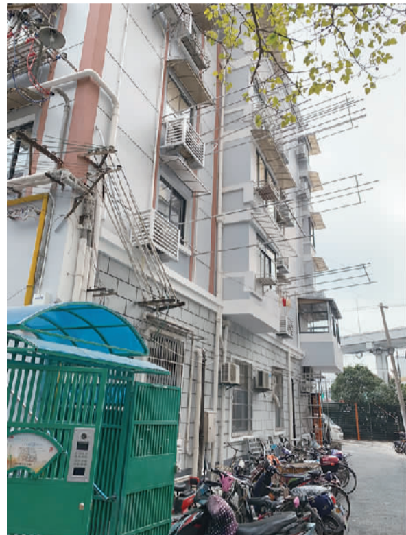
小区外立面改造前后对比图