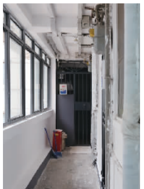
楼道改造前后对比图