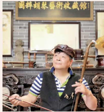
人社会资源合作,精心打造上海首家以“胡琴文化”为主题,集多种收藏于一体的民间特色艺术馆——国粹胡琴艺术收藏馆。2014年6月29日,“国粹胡琴艺术收藏馆”正式成立,位于华漕镇文体中心纪翟路550号,2017年11月搬入华漕美术馆。