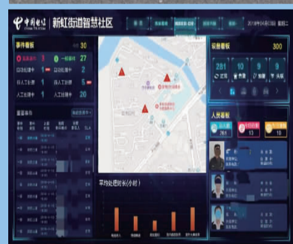
新虹智慧房管监督平台运行界面