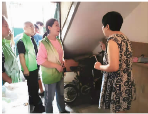
志愿者、民警督促居民自行清理楼道堆物

8月21日前，街道、各居委层层落实，制定楼道堆物整治计划，明确攻坚频次，确保责任到岗到人。