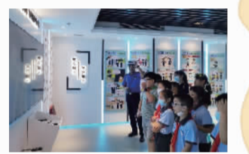
戏,在身边的场景中快速寻找违法行为……讲解员一边引导小朋友获得更好的游戏体验,一边穿插介绍实用的法律知识,培养大家的法律意识。

的工作内容,向大家展示自己“百宝箱”中的装备……一线警官的职业分享激起了小朋友们的浓厚兴趣。张警官还通过实战教学和模拟互动,向孩子们演示危急情况下的自救方法,为暑期安全生活增加一道防线。 在普法体验基地新时代文明实践益空间,小朋友们都玩开了。大家戴上VR设备,对身边随机出现的垃圾进行虚拟投掷,巩固垃圾分类知识。当法眼观察解密区的投影开启时,小朋友们迅速进入游