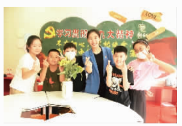
“护士姐姐们辛苦了!你们真了不起!”听着孩子们发自肺腑的话语,捧着向日葵,护士姐姐们都被感动到了:“没想到还有这样一份惊喜,小朋友们有心了!”

么感觉?”分享结束后,小朋友好奇地问着问题。一位小女孩表示:“我长大后也想当护士,遇到再大的困难我也愿意坚持下去!” “虹孩子”们还为护士姐姐准备了一份惊喜。活动当天,他们提前一个小时来到现场,手工制作向日葵送给护士姐姐。教大家手工的是一群“小老师”——来自上宝中学的学生。在小老师的带领下,小朋友们你追我赶,一张张彩纸在小朋友的手中变成了向日葵的样子。小朋友们把做好的向日葵藏进了角落,打算在护士姐姐分享完后给她们的一个惊喜。