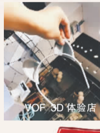
VOF 3D 体验店