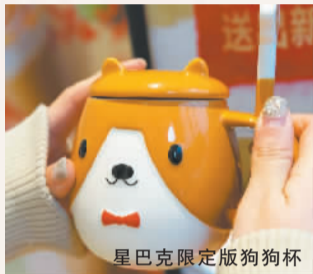
星巴克限定版狗狗杯