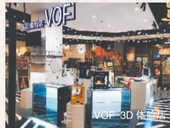
VOF 3D 体验店