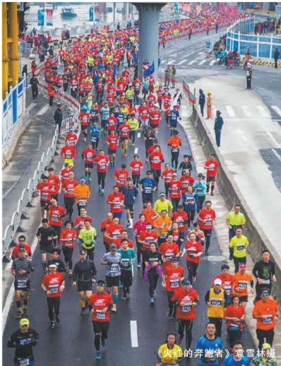
《火红的奔跑者》