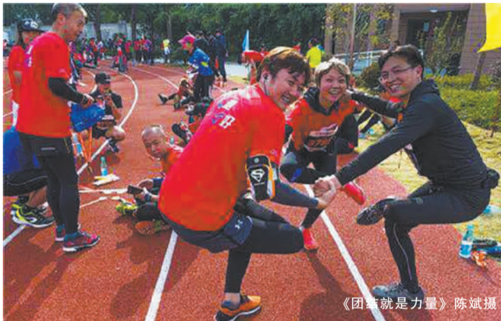
《团结就是力量》