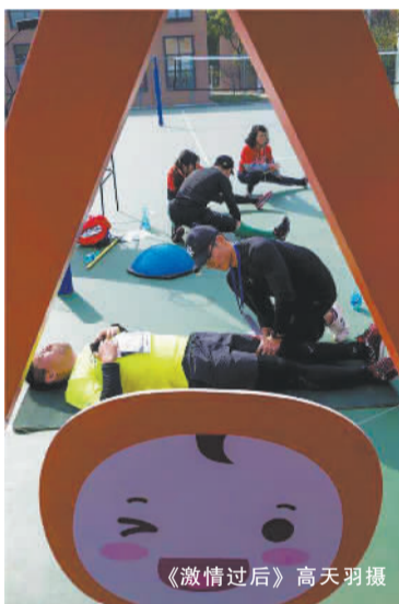
《激情过后》