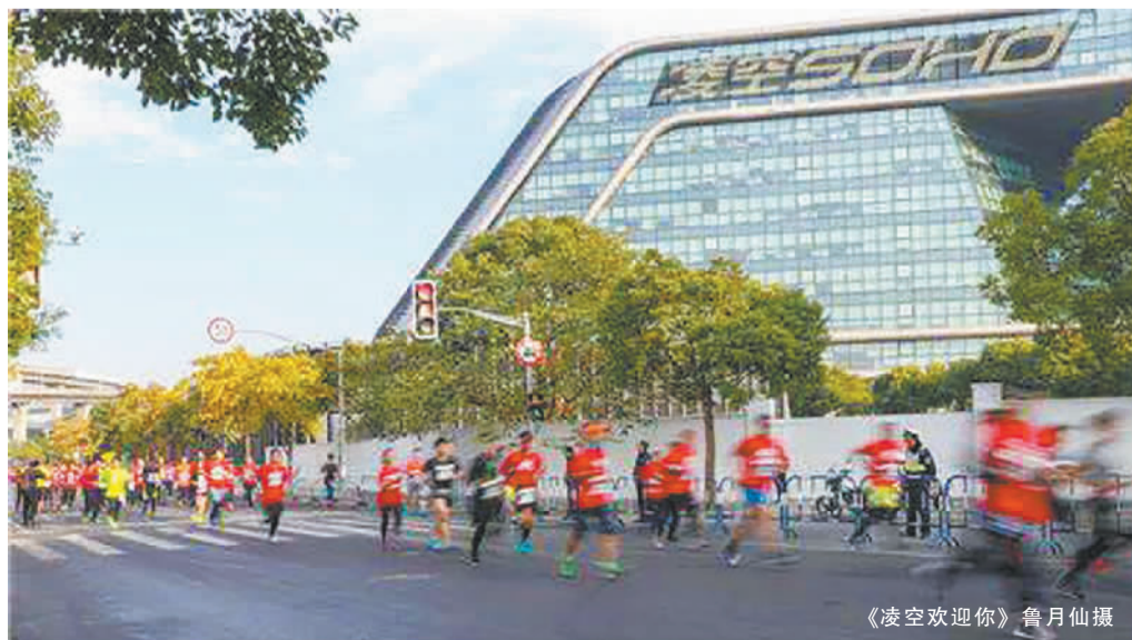
《凌空欢迎你》

在新泾镇发展史陈列馆,关于长宁“半马”的摄影作品可不止这些,大家可以前往参观,更多精彩作品等着你。