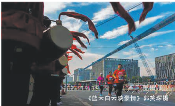
《蓝天白云映豪情》