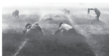
《泥土芳香》