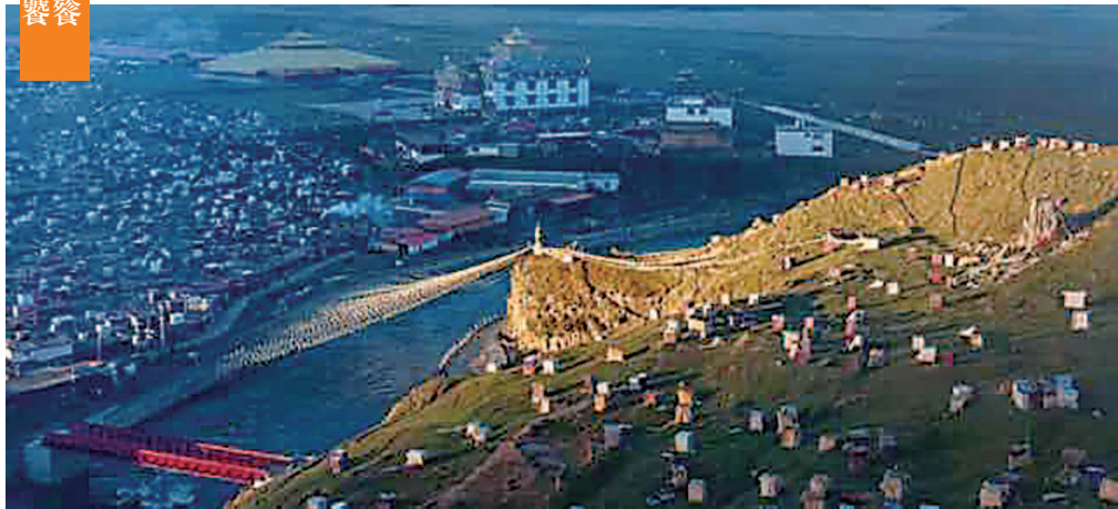
《高原秘境》