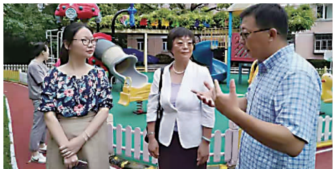
调研组走访调研淞虹公寓儿童乐园

重视儿童参与，让城市更美好。为全力打造儿童友好型城区，向社会传递儿童友好的声音，号召更多的人关注和保护儿童权益，为儿童发展谋求更多的福祉，长宁区一直在努力着，新泾镇也将携手守护孩子的梦，争创上海市儿童友好社区示范点。