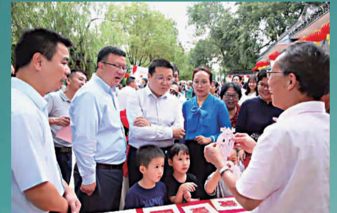
区、镇领导观赏海派剪纸展