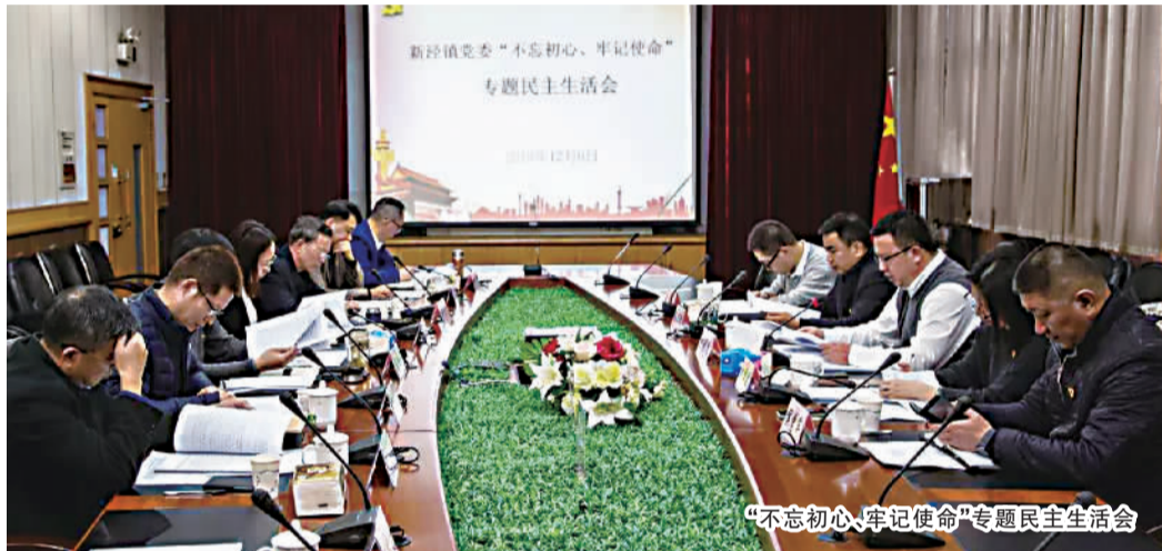
“不忘初心、牢记使命”专题民主生活会

镇党委对开好这次专题民主生活会高度重视,严格按照有关要求制定工作方案。会前,做好四项准备工作。一是全力抓好学习教育。通过组织中心组学习,要求党员领导干部认真学习贯彻落实习近平新时代中国特色社会主义思想,学习党史、新中国史,学习党中央关于民主生活会的有关要求,打牢开好专题民主生活会的思想基础。二是深入开展谈心谈话。领导班子成员之间,班子成员与分管单位负责同志、与机关党支部党员代表,开展谈心谈话,交流思想、交换意见151人次。三是系统梳理检视问题。对照党章党规找出的问题、调研发现的问题、群