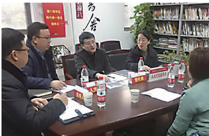
代表委员们与居民互动交流

针对居民们反映的“美丽家园”二次供水设施改造项目、小区智能安防建设、仙霞西路路段标线设置等问题和建议,代表委员们与居民积极互动交流,不时询问,耐心解答,并通过工作信笺方式反馈至区、镇相关部门,争取“件件有落实、事事有回音”。