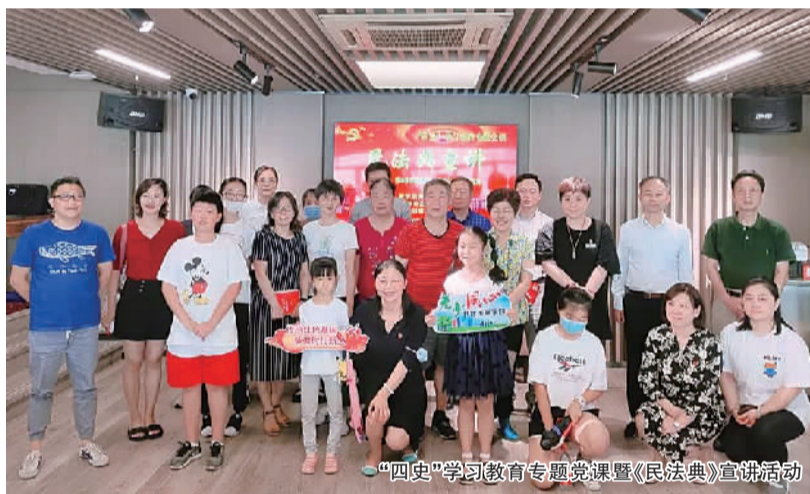
“四史”学习教育专题党课暨《民法典》宣讲活动

转眼间,快乐的暑假生活已经结束了。两个月的悠长假期,大家过得如何呢?回顾精彩一“夏”,斜土的青少年们收获了街道精心准备的夏日限定“修炼手册”。