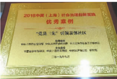
▲“党员三先”引领亲邻社区建设”志愿服务项目获评“2018中国(上海)社会治理十大创新实践案例”

延伸到楼组,纵向到居民的志愿组织动员体系网,以深入楼组的“小网格”筑起社区志愿“大格局”。