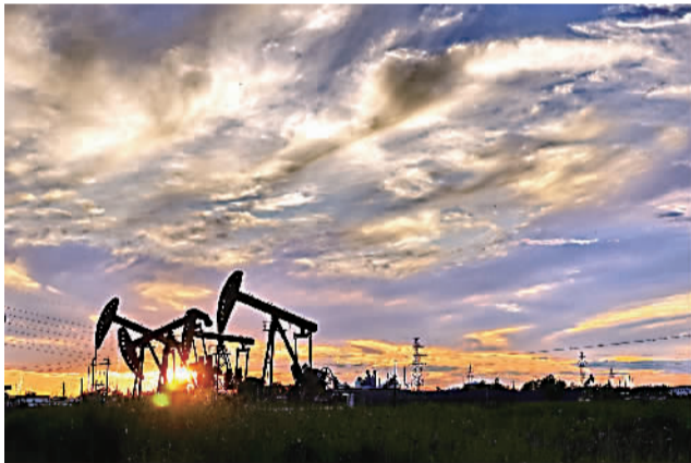
《辛苦了,大庆!》 王荣培