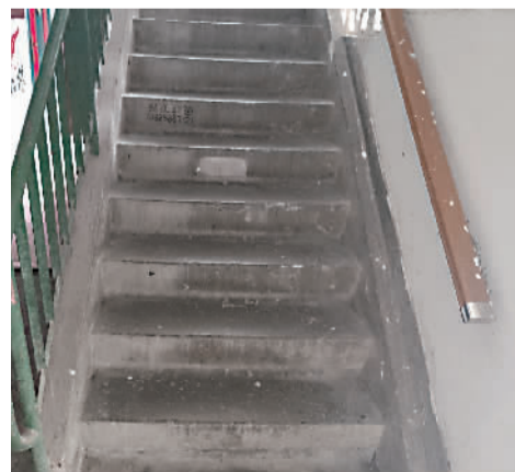
杜家宅小区加装的楼道扶手