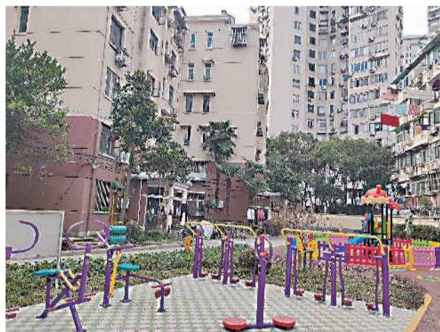
杜家宅小区改造后的休闲广场