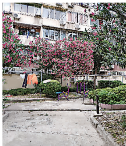
杜家宅小区改造前的健身点

今年,仙霞街道通过各居民区自下而上征集、上报、统计汇总、筛选,确定了绿化护栏安装、楼道门头雨篷安装、休闲椅安装、晾衣架安装、信报箱整修、休闲点建设、自行车棚整修、扰民大树整修、楼道扶手安装、绿化建设、休闲凉亭长廊紫藤架建设、道路修补、技防物防建设、宣传栏建设等14类94个“小而精”项目,帮助老百姓