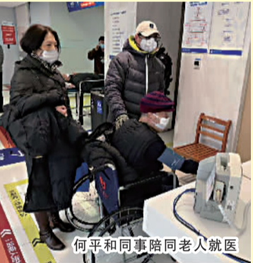
何平和同事陪同老人就医

天山五村由五一、五三、美三个居委会组成，五一居民区作为天山五村的主体，面积最大，小区住宅楼不少都是上世纪50年代末建造的老公房，小区内人员结构复杂，生活、居住困难群体多，外来人口多，约占实有人口的半数。