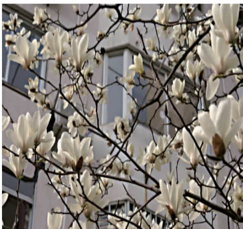
唐尚宪(茅台新苑居民区)的摄影作品《春天终会来临》