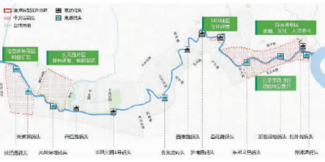
苏州河沿岸重点功能区分布图→

上周，上海市规划和国土资源管理局公布了《黄浦江、苏州河沿岸地区建设规划》，规划中提到，苏州河中心城区段——东起苏州河黄浦江口、西至环西一大道（外环线）将实现滨水空间全线贯通。其中，苏州河长宁段将新建8座桥以及4处旅游码头，在离中山公园不远，将新建曹家渡码头。快和杉杉一起来看看规划。