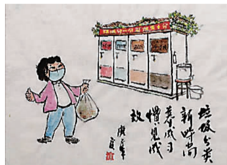
《养成习惯见成效》吕渲(古南)