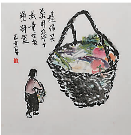
《提篮买菜》吕渲(古南)