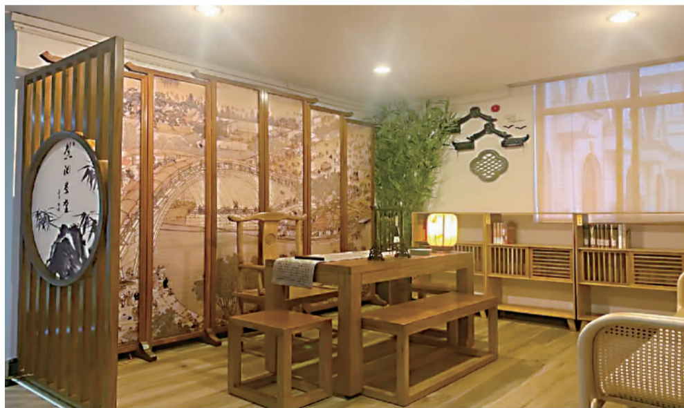
虹桥新城“馨阅草堂”

2020年12月9日，周家桥街道召开同“周”共“JI”基层党建论坛暨新时代文明实践总结表彰会，全面总结回顾2020年新时代文明实践建设成果，展望2021年建党百年工作设想。