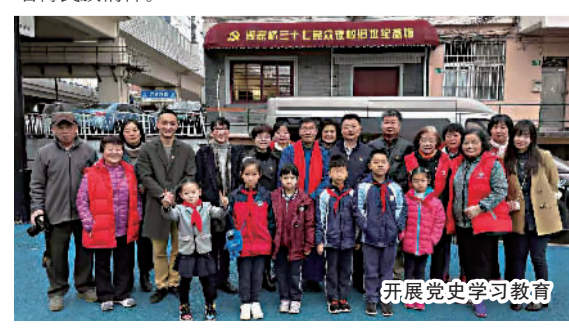
开展党史学习教育

今后,周家桥街道三十七民众夜校纪念馆将作为长宁区人文行走红色路线上的一个重要点位,聚力打造宣传社会主义核心价值观、凝聚社区共识的终身教育主阵地。通过有代表、有内涵、有温度的故事,让市民能够深入学习这段区域的红色党史,了解这段不同寻常的红色历程,进一步激发爱国热情,培育民族精神。