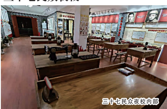
三十七民众夜校内部

【忆往昔】 周家桥街道三十七民众夜校遗址位于长宁区万航渡路2036号,是中共上海地下组织创办的省吾中学与中共沪西区委新泾分区委合作开办的一所工人夜校。