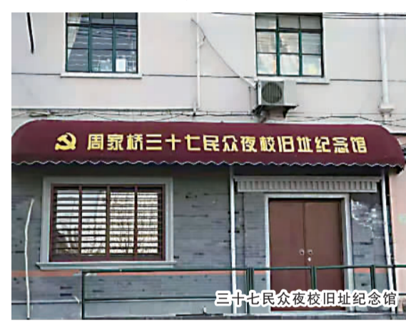
三十七民众夜校旧址纪念馆

【一街一品】 在三十七民众夜校不定期开展党史学习教育,并于万航渡路2036号设立“三十七民众夜校”铭牌。