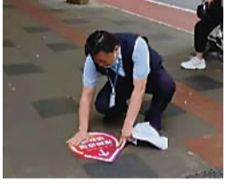
志愿者贴指引标识