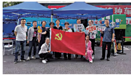
积极参与疫苗接种志愿工作