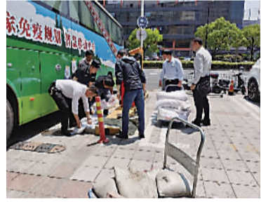
为流动接种车顺利停驻拆除基座