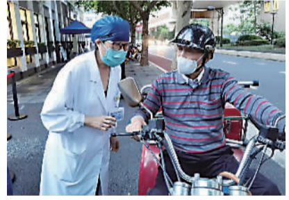
接种医生为接种者答疑解惑