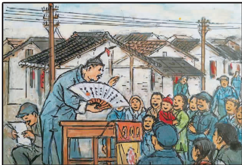
3 妙趣横生双簧戏,长袍翘辫手弄扇。嘴动无语示表情,一人隐后念唱词。