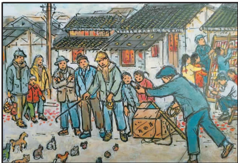
4 春节沿街燃鞭炮,互动拜年拎礼包。孩子在看小人书,路边这里把圈套。