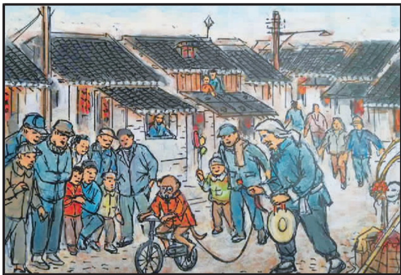
2 春节这里更热闹,和田路上在耍猴。小猴骑车正表演,大人孩儿皆喜欢。