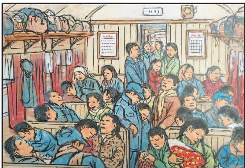
6 由于铁路还落后,车速缓慢小站多。经常交车晚点,乘客沿途好困倦。