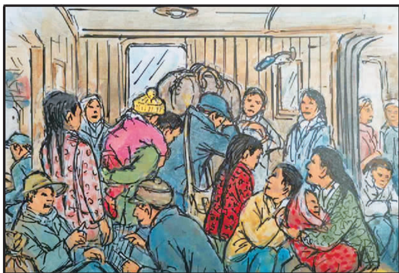
5 回乡探亲恨期短,眨眼功夫急返沪。火车超员客拥挤,车头梯口人亦满。