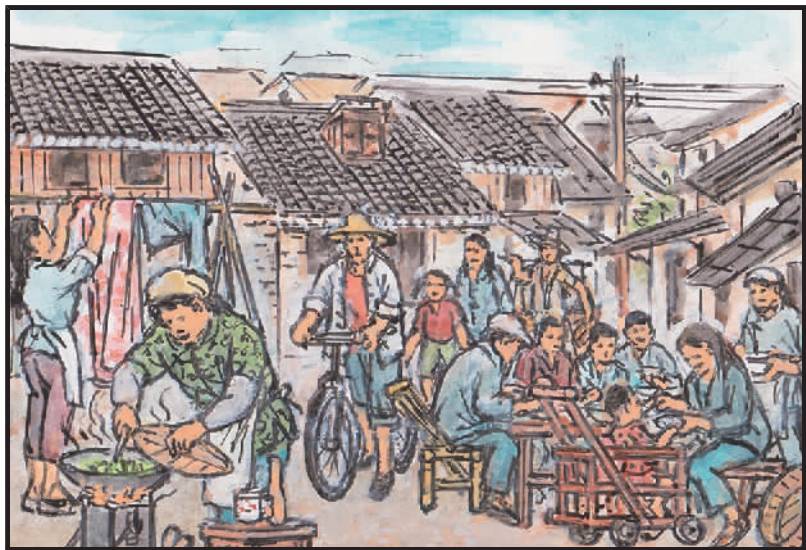
2 几代同居挤一起,屋小家务移外面。弄内到处是杂物,路人只能绕着行。