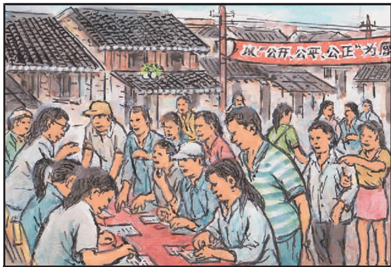
5 有望日子出了头,洪南山地被征收。居民纷至签约,迁户率高九成九。