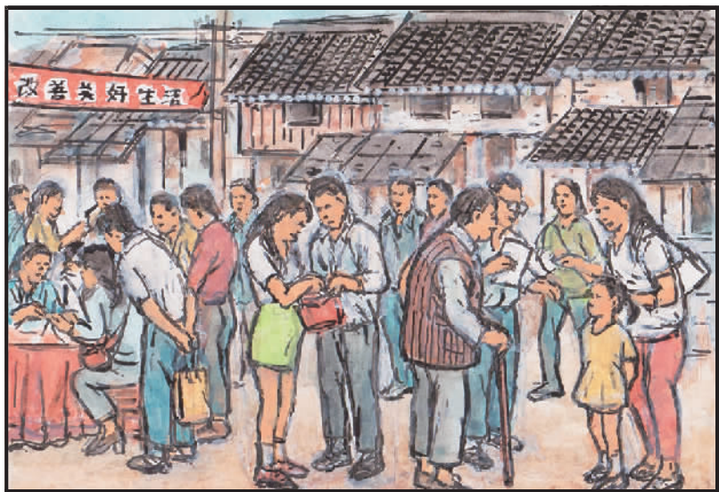
6 今获征收补偿款,好似一切美梦圆。可买如意称心楼,居民终享新生活。