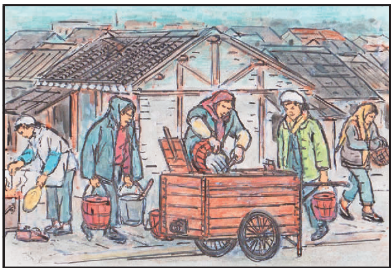
4 严冬门窗寒风穿,晨生煤炉倒马桶。深夜排队去买菜,洪南山人够艰苦。