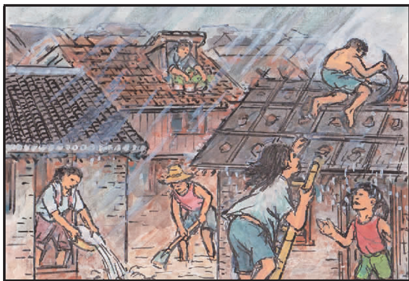
3 夏暑高温天炎热,暴雨台风屋面掀。臭虫蟑螂老鼠串,苍蝇蚊虫到处飞。