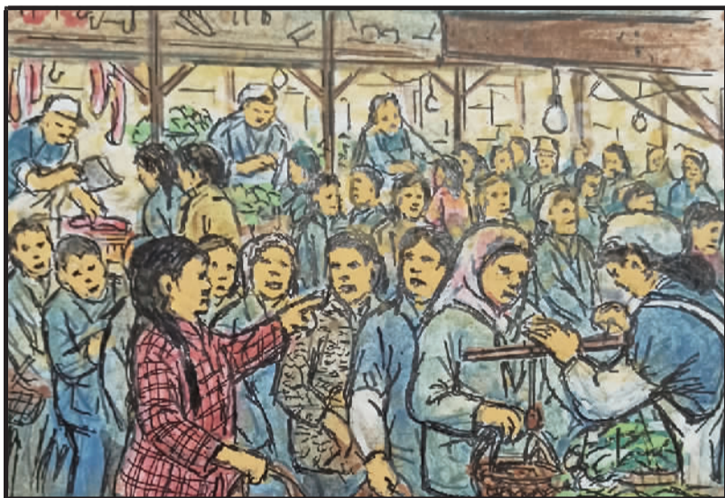
1 育婴堂路菜场内,过去深夜就排队。由于蔬菜上市少,常因排队引争吵。

与食物相关的记忆会被分散存储在大脑的各个感觉中心,被大脑的海马体所回忆。如果感觉刺激产生某种记忆,其他感觉器官感知和记忆的场景也会出现。