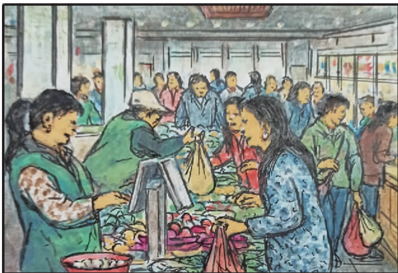
3 猪肉凭票供量少,牛羊肉类难吃到。蔬菜紧张限斤买,现今充裕敞开来。