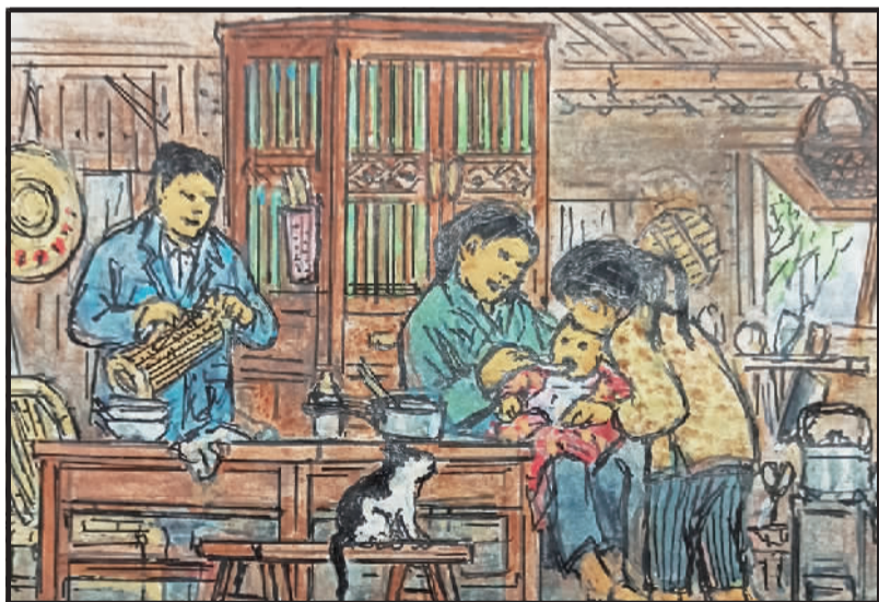
4 牛奶奶粉在过去,一般家庭吃不起。缺奶婴儿米糊喂,今吃牛奶人普遍。