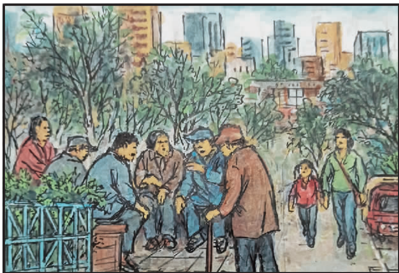
6 现在退休人有福,穿吃不愁有积蓄。自选养成保健品,饭后乐趣嘎讷胡。