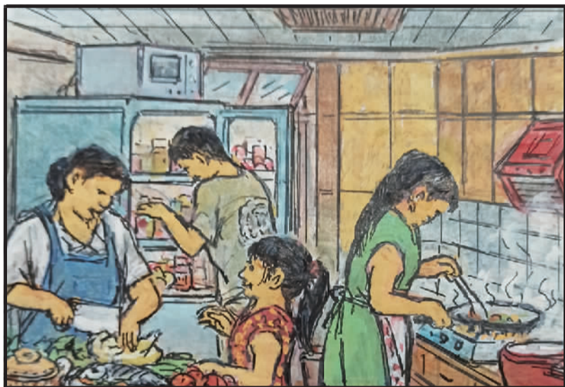
2 一年只吃一只鸡,还需待到春节时。而今想吃随上桌,烧烤白斩随心意。