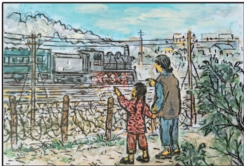
1 当初沪宁建铁路，沿线铁丝网拦隔。栏外形成一条路，便是现在交通路。

2003年，全新的交通公园居委会成立，由原熙安里、桥东、交通公园3个居委会合并而成。“炒米浜”于2009年开始动拆迁，2014年和源馨苑建成，新的交通公园居民区面貌焕然一新，小区都建有绿化带，配置了各种健身器材，居民在家门口健身很方便，幸福感和满意度也大大提高了。