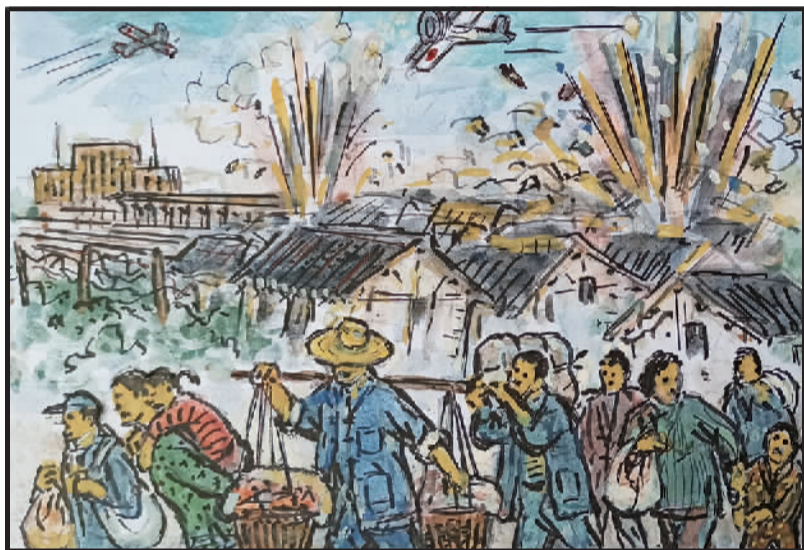
2 日寇侵略上海时，轰炸铁路火车站。虬江交通路一带，民房遭毁人逃难。