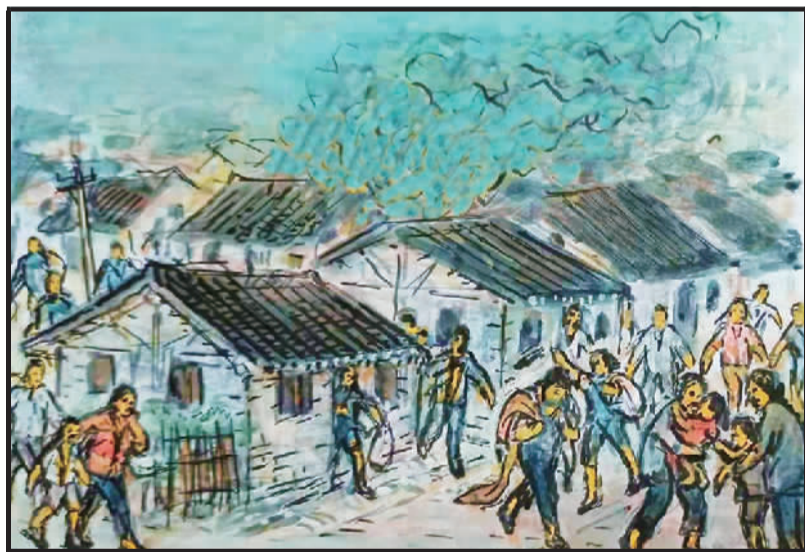
3 抗日战争胜利后，交通民居又重建。交通公园原住民，受灾安置苏家巷。