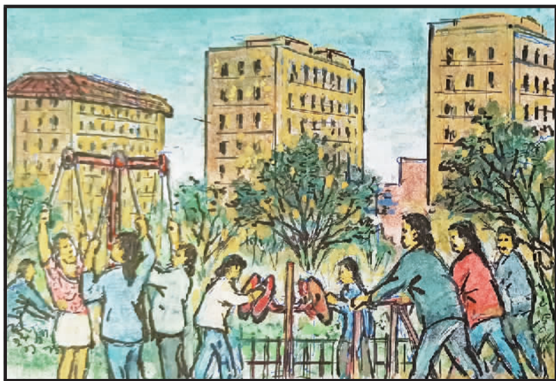
6 而今静安芷江西，小区都建绿化带。健身区域器材多，居民家门口健身。