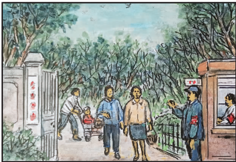
4 芷江附近少绿地，拍照休闲无处去。市政规划建公园，交通公园就地建。