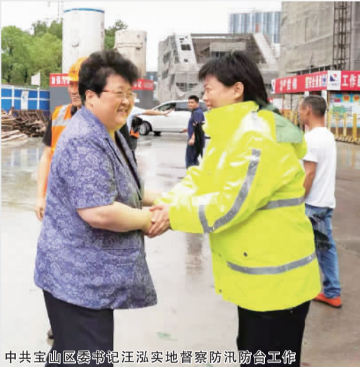
中共宝山区委书记汪泓实地督察防汛防台工作