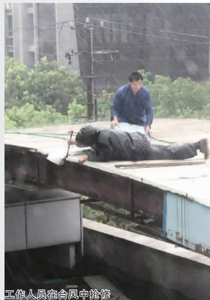
工作人员在台风中抢修

各居民区也持续不断地加强防汛防台宣传,在小区门栋前贴告知书,提前处理高空坠物隐患,提前准备好应急抢险队伍和抢险物资,并且24小时都有专职人员值班,随时做好应急抢险的准备。