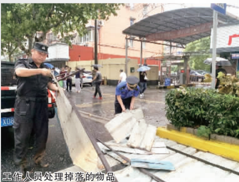
工作人员处理掉落物品

各职能部门加强防汛防台宣传,排查隐患、加固除险,对于防汛防台过程中出现的突发情况,能够事事有回应,件件有落实。