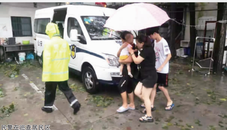
民警在巡查居民区