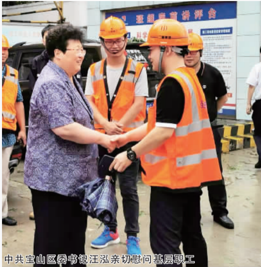
中共宝山区委书记汪泓亲切慰问基层职工

中共宝山区委书记汪泓带队前往张庙街道实地督察防台防汛工作落实情况。她向坚守在一线的防汛防台防汛人员致以感谢与敬意,并叮嘱他们在注意自身安全的情况下全力做好各项工作。