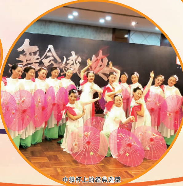
中粮杯上的经典造型