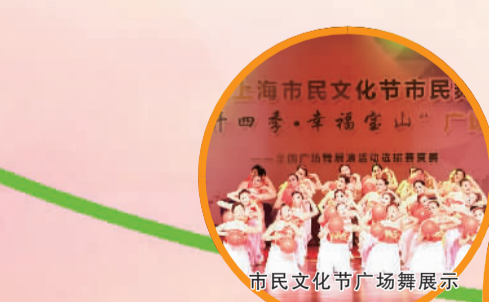
市民文化节广场舞展示