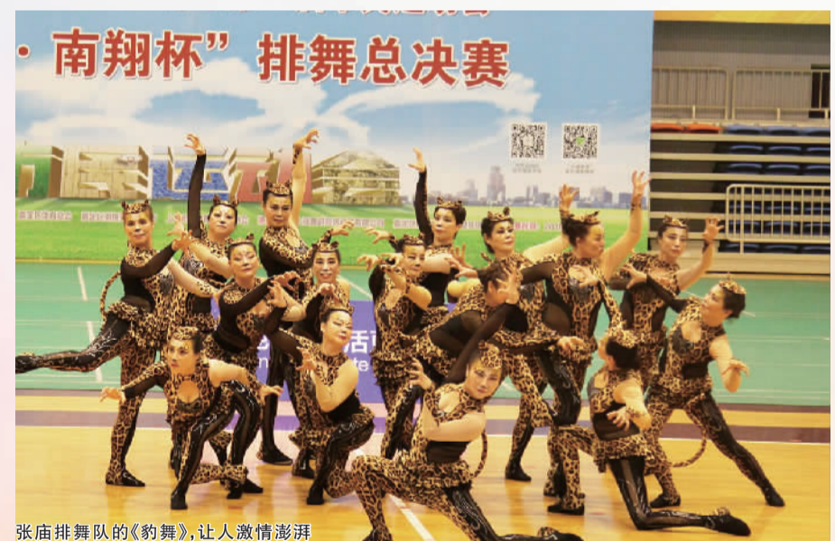
张庙排舞队的《豹舞》,让人激情澎湃

近年来,为了响应全民健身的号召,乐邻艺术团组建了广场舞队,是由艺术团内的排舞队和民舞队合并而来,在人数扩大的基础上,让社区的广大居民,也能积极参与进来!