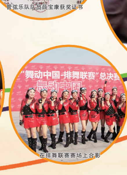
在排舞联赛赛场上合影