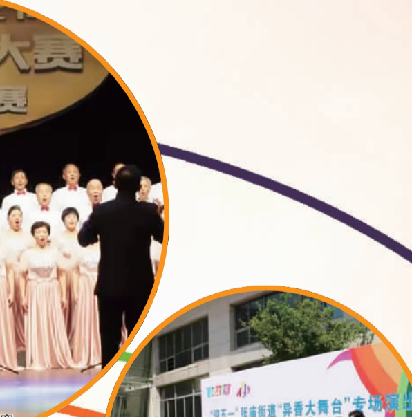
异香大舞台上展风采