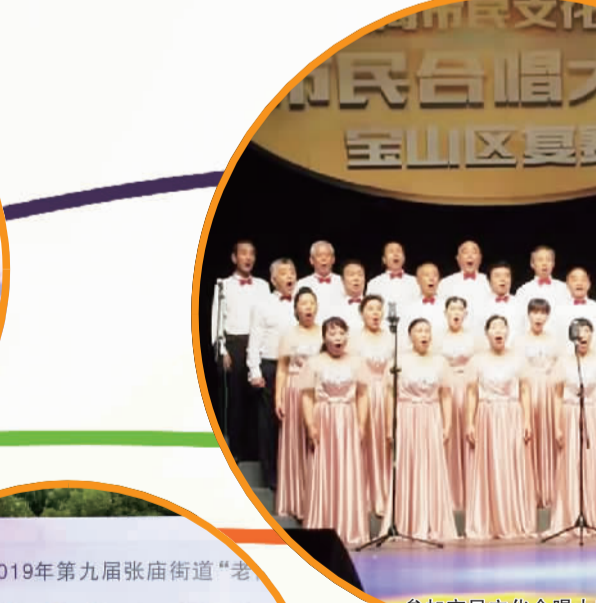
参加市民文化合唱大赛