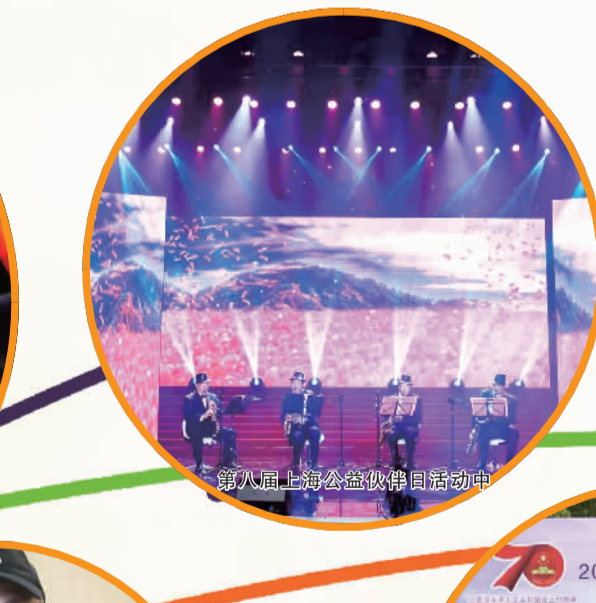
第八届上海公益伙伴日活动