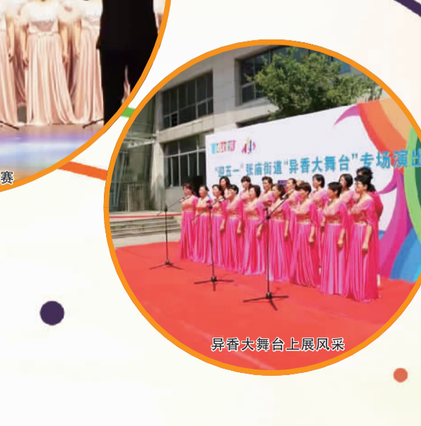
异香大舞台上展风采